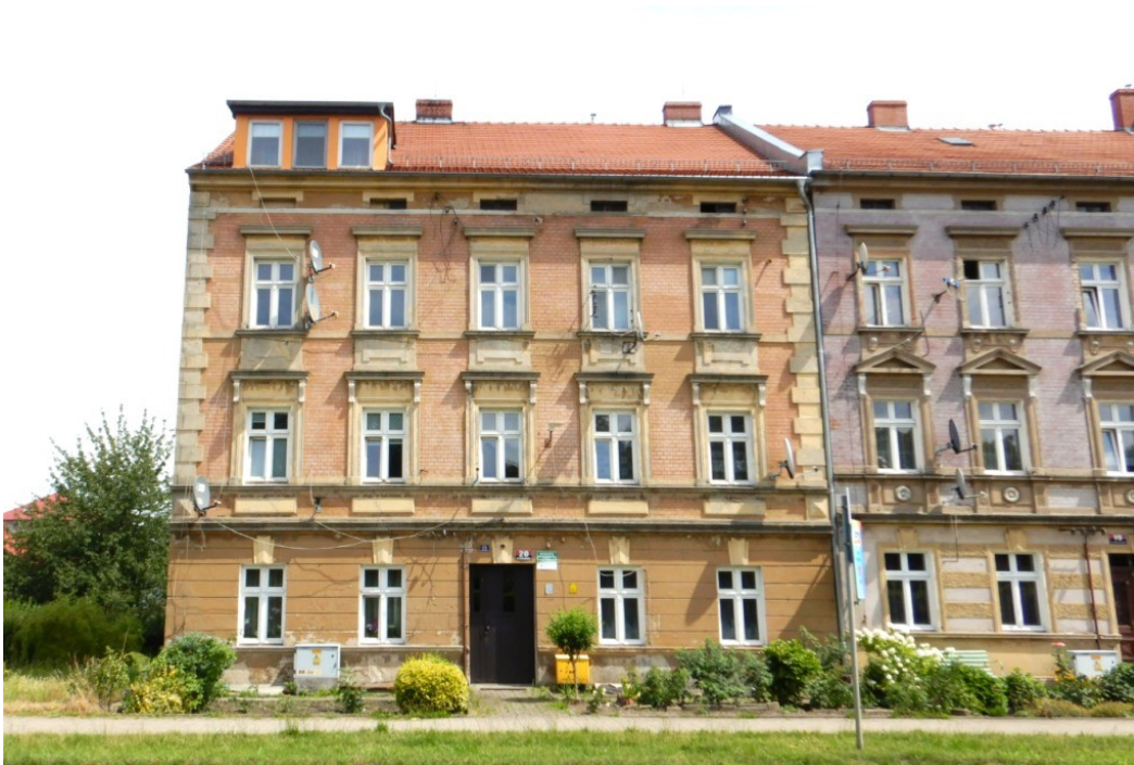
Ogólny widok budynku

na sprzedaż lokalu mieszkalnego Nr 6 znajdującego się w budynku położonym w Lubaniu przy ul. Warszawskiej 20 wraz z udziałem we współwłasności nieruchomości gruntowej (działka nr 46, AM 10, Obręb III o powierzchni 218 m 2 , JG1L/0003553/3)